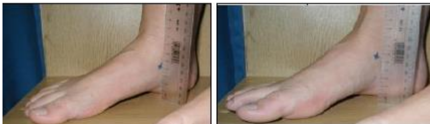
وضعیت بدون تحمل وزن

در ادامه مطالعه منصرف شدند. تمام فعالیت‌های تمرینی بازیکنان از ابتدا تا انتهای فصل در فرم ویژه به صورت روزانه به دست مربی تیم ثبت می‌شد. از کادر پزشکی تیم‌های مشارکت‌کننده درخواست شد آسیب‌های بازیکنان را در فرم ویژه ثبت کنند. این فرم‌ها به صورت هفتگی جمع‌آوری می‌شد. در این مطالعه، آسیبی ثبت می‌شد که در تمرین یا مسابقه رخ داده باشد و بازیکن آسیب‌دیده قادر نباشد در جلسه تمرینی یا مسابقه روز بعد تیم (حداقل ۴۸ ساعت) مشارکت جوید (تعریف آسیب بر مبنای غیبت از تمرین یا مسابقه) (۲،۶). در ابتدای این مطالعه، فرم رضایت‌نامه اخلاقی به دست بازیکنان امضا شد و سپس، در ابتدای فصل، افت ناوی پای چپ و راست، زاویه Q چپ و راست، زانوی پرانتزی، زانوی ضربدری و زاویه هایپیر اکستنشن مفصل زانوی بازیکنان اندازه‌گیری شد. برای اندازه‌گیری افت ناوی از آزمون برودی استفاده شد. برای این کار، ابتدا از آزمودنی درخواست می‌شد روی صندلی بنشیند، درحالی‌که ران و زانوی او در وضعیت فلکشن ۹۰ درجه، کف پاهای او روی زمین و مفصل ساب تالار او در وضعیت خنثی و در وضعیت بدون تحمل وزن قرار داشت. آزمونگر برجستگی استخوان ناوی آزمودنی را لمس و مشخص می‌کرد و فاصله آن را تا زمین با خط‌کش اندازه‌گیری می‌کرد. سپس، از آزمودنی خواسته شد در وضعیت ایستاده قرار گیرد و پاها را به اندازه عرض شانه باز کند و وزن بدن را به طور مساوی روی دو پا در وضعیت تحمل وزن قرار دهد. فاصله استخوان ناوی تا زمین دوباره اندازه‌گیری خواهد شد. اختلاف بین این دو وضعیت به میلی‌متر به منزله مقدار افت ناوی ثبت می‌شد (شکل ۱) (۲۳).