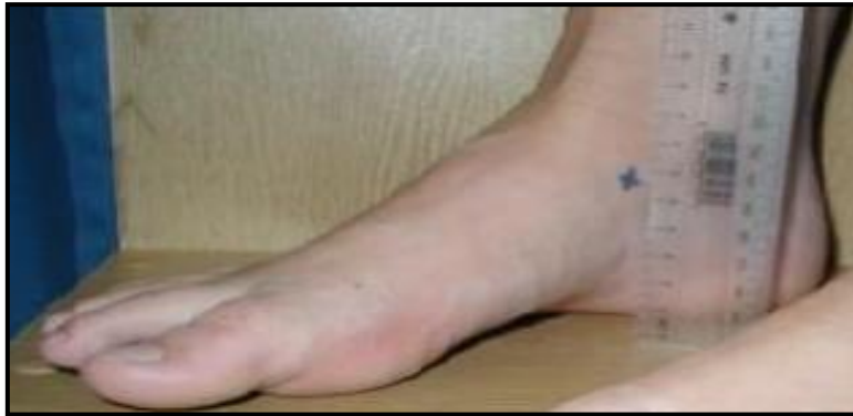
شکل ۳. اندازه گیری افت ناوی

در جدول شماره ۱، میانگین و انحراف معیار اطلاعات توصیفی مربوط به اندازه گیری های آنترپومتریک آزمودنی ها شامل قد، وزن و سن جهت شناخت بیشتر ویژگی های آزمودنی ها ارائه شده است.