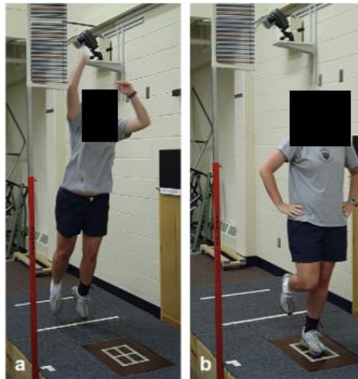
شکل ۱. نحوه انجام پروتکل پرش-فرود روی دستگاه توزیع فشار کف پا

می‌کرد. آزمودنی‌ها چندین مرتبه آزمون را به منظور آشنایی انجام می‌دادند و در آخر، سه مرتبه، آزمون تکرار و داده‌ها ثبت می‌شد (۱۶) (شکل ۱).