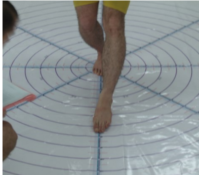
شکل ۳. آزمون تعادل پویا (۲)

تبادل ایستا، هر آزمودنی این تست را سه مرتبه اجرا و میانگین سه اجرای وی به عنوان رکورد نهایی وی در نظر گرفته شد. شافر ۱ پایایی بسیار بالایی (۰/۹۳ - ۰/۸۵) را برای این آزمون گزارش کرده است (۲۳).