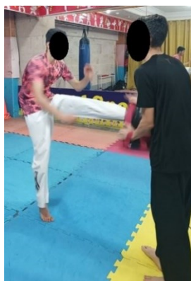
شکل ۱. پروتکل خستگی عملکردی

جهت اعمال پروتکل خستگی، از پروتکل خستگی عملکردی رشته تکواندو که اثرگذاری آن پیش از این توسط میرجانی و همکاران به اثبات رسیده است استفاده شد (۳). پروتکل مذکور به این صورت بود که آزمودنی‌ها ضربه آبدولیوچاگی را با حداکثر توان و در حداقل زمان اجرا، در مسیر هشت متری (برابر با طول زمین تکواندو) بصورت متوالی (یک ضربه با پای چپ و یک ضربه با پای راست) و رفت و برگشت، اجرا کنند. هر رفت و برگشت در این مسیر یک ست در نظر گرفته شد و پیش از اجرای پروتکل خستگی به منظور آشنایی افراد با نحوه‌ی اجرا، هر آزمودنی دو مرتبه ست مذکور را اجرا کرد. پس از شروع در جریان پروتکل خستگی بین هر ست دو برابر زمان به دست آمده در ست اول (نسبت کار به استراحت یک به دو) به افراد استراحت فعال بصورت رقص پای تکواندو داده شد، تا جایی که فرد به خستگی برسد. خستگی زمانی در نظر گرفته شد که افراد ۳۰ مرتبه این ست را در مدت زمان حداقل ۱۹ دقیقه طی کرده و بر اساس مقیاس بورگ، خستگی برابر با ۱۷ به بالا را گزارش کنند (۳).