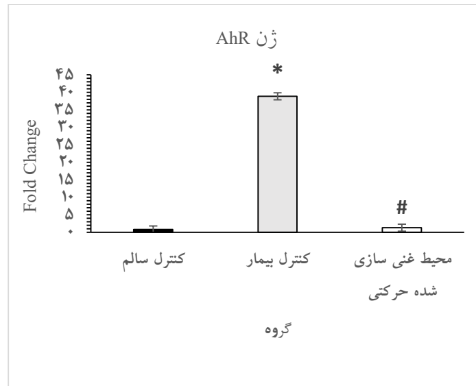
شکل ۲. بیان ژن گیرنده آریل هیدروکربن (AhR) در بین گروه‌های مطالعه. * P < 0.05 در مقایسه با گروه کنترل سالم. # P < 0.05 در مقایسه با گروه کنترل بیمار.