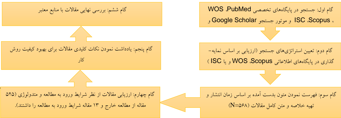
دیاگرام 1. نحوه بررسی کیفیت مقالات

تحلیل حذف شد. برای مشخص کردن عدم تجانس از آزمون I^2 استفاده شد که مقدار ناهمگونی بر اساس دستورالعمل کوکران به شرح زیر > 25\% = کم ، > 50\% = متوسط و > 75\% = ناهمگونی زیاد تفسیر شد. در صورت وجود ناهمگونی، در ادامه تحلیل حساسیت از طریق روش خارج کردن یک به یک مطالعات با لحاظ کردن I^2 کمتر از 50 به عنوان ملاک انجام شد (13). سوگیری انتشار نیز با استفاده از تفسیر بصری از فونل پلات بررسی شد که در صورت وجود سوگیری، تست ایگر به عنوان به مشخص کننده ثانویه استفاده شد که در آن P < 0.1 به عنوان وجود سوگیری انتشار قلمداد شد. همچنین همبستگی سن و شاخص توده بدن آزمودنی‌ها با اندازه اثر تفاوت‌های میانگین استاندارد شده با استفاده از رگرسیون مدل لحظه‌ای بررسی شد (13). تمام آزمون‌های آماری با استفاده از نرم افزار CMA انجام شدند.