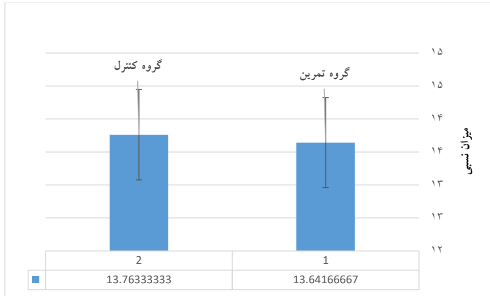
نمودار ۱. میانگین و انحراف استاندارد \Delta ct GPX4 در هر دو گروه