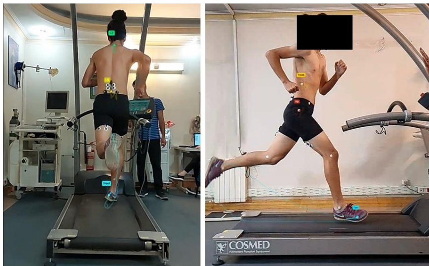
شکل ۲. آزمون دویدن

جهت بررسی کینماتیک دویدن در سرعت بالا از ارزیابی کینماتیکی دو بعدی توسط دوربین سرعت بالا ساخت شرکت سونی IMX514 (برای متغیرهای خم شدن توراسیک و خم شدن جانبی توراسیک) و همچنین ارزیابی سه بعدی کینماتیک با استفاده از شتاب سنج (ارزیابی دامنه تیلت قدامی لگن)، استفاده شد. مارکرها بر روی دنده دوازدهم، خار خاصره قدامی فوقانی، برجستگی بزرگ ران، کندیل خارجی زانو، قوزک خارجی مچ پا، استخوان پنجم کف پا، پاشنه، مهره هفتم گردنی و مهره پنجم کمری قرار گرفتند. پس از مارکگذاری آزمودنی ها و قرارگیری مناسب محل دوربین ها، با توجه به قد آزمودنی ها، آزمون دویدن بر روی تردمیل انجام گرفت. با توجه به این که آسیب همسترینگ در سرعت های بالای دویدن رخ می دهد، سرعت مورداستفاده در این آزمون ۲۰ کیلومتر بر ساعت و بدون شیب بود (شکل ۲) (۲۴). ابتدا جهت گرم کردن، ورزشکار ۱۰ دقیقه بر روی سرعت های کمتر شروع به راه رفتن و نرم دویدن می کرد. وقتی که به سرعت ۲۰ کیلومتر بر ساعت رسید به تعداد ۳۰ قدم در این سرعت می دوید. داده های مورد ارزیابی در قدم های بین ۱۵ تا ۲۵ ضبط شدند. همچنین این اندازه گیری ها ۳ بار انجام گرفت و میانگین داده ها ثبت شد. جهت جلوگیری از خستگی، آزمودنی بین هر بار دویدن ۵ دقیقه استراحت می کرد.