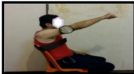
شکل ۲. وضعیت قرارگیری فلکسومتر جهت ارزیابی حس عمقی دور شدن و خم شدن (برگرفته از کار پژوهشی صاحب‌الزمانی و همکاران ۱۳۹۷)