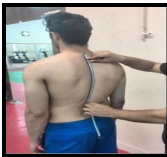
شکل ۸. اندازه‌گیری زاویه کایفوز با خط کش منعطف (برگرفته از کار پژوهشی رجبی و همکاران ۱۳۹۴)

است و مهره پایینی آن مهره اول پشتی است. سپس با استفاده از شمارش مهره چهارم سینه‌ای مشخص می‌شود. برای یافتن زائده خاری مهره دوازدهم سینه‌ای از روش یوداس استفاده شد. به گونه‌ای که آزمونگر در پشت آزمودنی قرار می‌گرفت و لبه تحتانی دنده‌های دوازدهم در دو طرف بدن به صورت هم‌زمان با استفاده از انگشتان شست لمس و مسیر آن‌ها به سمت بالا و داخل ادامه داده شد تا جایی که آن‌ها در زیر بافت نرم ناپدید شوند، در این لحظه مسیر دو انگشت به صورت افقی به یکدیگر متصل شد تا به زوائد خاری مهره‌ها برسد. این محل زائده خاری مهره دوازدهم سینه‌ای است. سپس این دو نقطه با استفاده از رنگ تیره نشانه‌گذاری شد که به سادگی از روی پوست قابل پاک شدن بود (به منظور اطمینان یک‌بار دیگر از زائده خاری مهره هفتم گردن تا مهره دوازدهم پشتی شمارش شد). سپس فرد در محلی که برای او مشخص شده بود در شرایطی که پاها به اندازه عرض شانه از یکدیگر فاصله داشت در حالت طبیعی ایستاده و روبه‌جلو و بدون حرکت قرار گرفت و خط کش منعطف بر روی ستون فقرات در حد فاصل مشخص شده قرار گرفت و پس از شکل‌پذیری به آرامی و بدون ایجاد تغییر روی کاغذ منتقل شد و با مداد شکل قوس از روی لبه‌ای از خط کش که با پوست در تماس بود بروی کاغذ انتقال داده شد و هر اندازه‌گیری سه مرتبه تکرار شد. نقطه مبدأ قوس رسم شده با خط مستقیم به نقطه انتهایی آن متصل شد و به عنوان (ال) و از عمیق‌ترین نقطه در حد فاصل نقطه مبدأ به نقطه انتهایی به صورت عرض از شکل قوس به خط طولی متصل شد و به عنوان (اچ) در نظر گرفته شد. سپس با استفاده از فرمول مثلثاتی ( ICC = 0.95 ) میزان زاویه کایفوز تعیین شد (۱۷). میانگین هر سه اندازه‌گیری مربوط به هر یک از نمونه‌ها به عنوان زاویه کایفوز ثبت شد (۱۷).