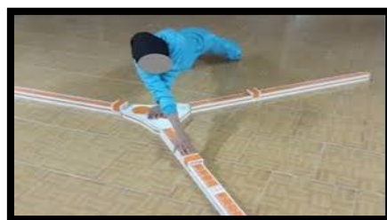
شکل ۵. دستگاه آزمون عملکردی اندام فوقانی

اندازه‌گیری سر به جلو: برای سنجش سر به جلو از روش اندازه‌گیری زاویه کرانیوورتبرال استفاده کردیم. در این روش هرچقدر زاویه مذکور کوچک باشد حاکی از شدت بیشتر سر به جلو است که در یک تحقیق داخلی دامنه طبیعی زاویه کرانیوورتبرال بین ۴۵ تا ۵۳ درجه گزارش شده است (۶). برای اندازه‌گیری وضعیت سر به جلو با این روش از یک گونیامتر مخصوص استفاده کردیم در این روش آزمودنی در حالت ایستاده بوده و سه بار حرکت فلکشن و اکستنشن گردن را انجام داد تا شرایط عضلانی غیرطبیعی از بین برود و سر و گردن فرد در حالت طبیعی و عادی خود قرار بگیرد. سپس آزمونگر در سمت چپ آزمودنی ایستاده و بازوی ثابت گونیامتر را عمود بر زمین، محور گونیامتر را در نمای جانبی موازی با زائده خاری C7 که قبل آزمون علامت‌گذاری شده بود قراردادیم و بازوی متحرک گونیامتر بر روی غضروف بخش قدامی گوش (تراگوس گوش) تنظیم شد. بعدازآن زاویه بین بازوی متحرک و خط افقی که از مهره C7 عبور کرده بود به عنوان زاویه کرانیوورتبرال (۰/۹۳) ICC=) ثبت شد (۱۵). ضمناً «عددی که به عقربه نزدیک بود زاویه را نشان می‌داد و اگر عقربه بین دو عدد قرار گرفت عدد کوچک‌تر ثبت شد و در مجموع سه بار اندازه‌گیری انجام شد و بین هر تست یک استراحت دودقیقه‌ای به فرد داده شد و در پایان از میانگین سه تست برای ارزشیابی استفاده کردیم (۶, ۱۵).