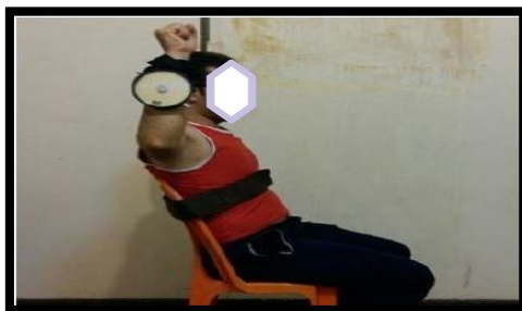
شکل ۳. وضعیت قرارگیری فلکسومتر جهت ارزیابی حس عمقی چرخش خارجی و داخلی (برگرفته از کار پژوهشی صاحب‌الزمانی و همکاران ۱۳۹۷)