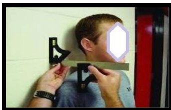
شکل ۷. اندازه‌گیری شانه روبه‌جلو (برگرفته از کار پژوهشی معصومی و همکاران ۲۰۱۱)

اندازه‌گیری شانه به جلو: برای تعیین کمیت وضعیت شانه به جلو (شانه گرد) از دستگاه چهار گوش دوگانه (طبق مدل 420 EM) استفاده شد. روایی و اعتبار چهار گوش ارزیابی شانه به جلو به صورت تخمین، بیان شده و محققین گزارش کردند که روش استفاده از چار گوش دوگانه همبستگی متوسطی با اندازه‌گیری رادیوگرافی داشته و از اعتبار بالایی ( ICC=0/89 ) برخوردار است (۱۱). در این روش از آزمودنی خواسته شد پوشش بالاتنه خود را درآورده و روبروی آزمونگر بایستد. بعدازآن زائده آخرومی سمت چپ و راست به عنوان نقطه‌ی مرجع علامت‌گذاری شد. سپس آزمودنی در جلوی دیوار ایستاده و ده بار درجای نظامی انجام داده، شانه‌هایش را سه بار به طرف جلو و عقب گرد کرده و سپس پنج بار سرش را جلو و عقب می‌برد. این توالی حرکت برای ایجاد یک وضعیت ایستادن نرمال انجام شد. آزمودنی بعدازآن به طرف عقب به سمت دیوار حرکت کرد تا وقتی که باسنش دیوار را لمس کند در این وضعیت باقی می‌ماند تا اندازه‌گیری کامل شود. بعدازآن فاصله بین دیوار و سر قدامی زائده آخرومی با استفاده از چهار گوش دوگانه به سانتی‌متر ثبت می‌شد، در ضمن اندازه‌گیری در هر شانه سه بار تکرار شده و میانگین آن‌ها در دست برتر (دست برتر آزمودنی‌ها قبل از آزمون با پرتاب توپ معلوم شده بود) استفاده می‌شد (۱۱، ۱۶).