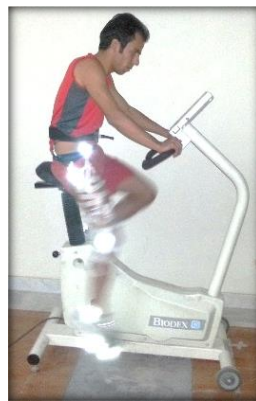
تصویر ۱: نحوه اجرای پروتکل رکاب زدن توسط آزمودنی

پس از نصب مارکرها روی بدن، آزمودنی برای اجرای پروتکل رکاب زدن آماده شد. نحوه اجرای رکاب زدن روی دوچرخه ایزوکیتیک برای آزمودنی توضیح و آموزش داده شد. هر آزمودنی ابتدا روی زین دوچرخه قرار می‌گرفت و ارتفاع زین برای وی تنظیم می‌شد. ارتفاع زین برای تمام آزمودنی‌ها به نحوی تنظیم می‌شد که در زمان قرار گرفتن رکاب در پایین‌ترین موقعیت، اندام تحتانی آزمودنی به طور کامل در حالت اکستنشن قرار گیرد. از آزمودنی‌ها خواسته شد هنگام انجام پروتکل رکاب زدن در شدت کار ۷۰ دور بر دقیقه رکاب زده و زمانی که به شدت کار ثابت ۷۰ دور بر دقیقه می‌رسید، اطلاعات کینماتیکی از اندام تحتانی به مدت ۳۰ ثانیه ثبت می‌شد. آزمودنی‌ها در طی مدت زمان ۳۰ ثانیه حدود ۳۳ چرخه کامل رکاب زدن را اجرا می‌کردند که از بین آنها تعداد ۳۰ چرخه متوالی برای انجام تحلیل‌های تغییرپذیری استخراج شد و مورد استفاده قرار گرفت. تصویر ۱ نحوه قرار گرفتن آزمودنی روی دوچرخه ایزوکیتیک را نشان می‌دهد.