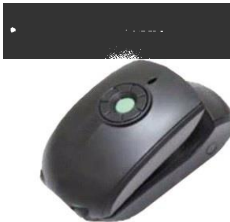
شکل ۱. سیستم آنالیزور لندمارک‌های بدنی

سیستم آنالیزور لندمارک‌های بدنی از یک قلم (فرستنده) و دوربین (گیرنده) که هر دو مجهز به سنسور IR هستند (کد ثبت اختراع: ۹۳۲۰۸) تشکیل شده است (شکل ۱).