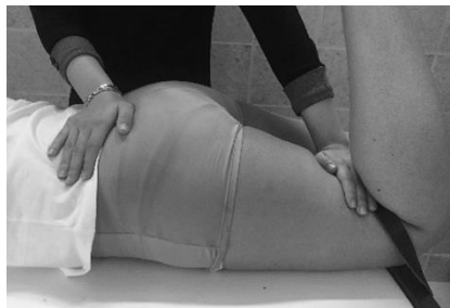
شکل ۱. نحوه اندازه‌گیری بیشینه قدرت ایزومتریک عضله سرینی بزرگ

انجام آزمون از بندهای محکم غیرقابل ارتجاع که از یک سمت به انتهای اندام موردنظر و از طرف دیگر به پایه تخت بسته می‌شد استفاده شد. این امر باعث اعتباربخشی بیشتر به آزمون‌های سنجش قدرت ایزومتریک با دینامومتر دستی می‌گردد (۲۶). از آزمودنی خواسته می‌شد که ۵ شماره با نهایت قدرت به دینامومتر دستی دیجیتال مدل JTECH Medical MN084_A Commander که در انتهای اندام و زیر بند ثابت‌کننده قرار داشت فشار وارد کند. مجموعاً سه بار اندازه‌گیری قدرت با انجام باز کردن بیش از حد ران به مقدار ۲۰ درجه، انقباضات ۵ ثانیه‌ای و استراحت ۳۰ ثانیه‌ای بین تکرارها انجام شد. میانگین سه عدد به دست آمده به عنوان ماکزیمم قدرت ایزومتریک عضله برحسب نیوتن ثبت گردید (۲۷). عدد به دست آمده بر وزن فرد برحسب نیوتن تقسیم شده و ضربدر عدد ۱۰۰ شد و ماکزیمم قدرت عضله برحسب درصد وزن بدن گزارش گردید.