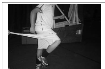
دست و پای مخالف (راه رفتن)