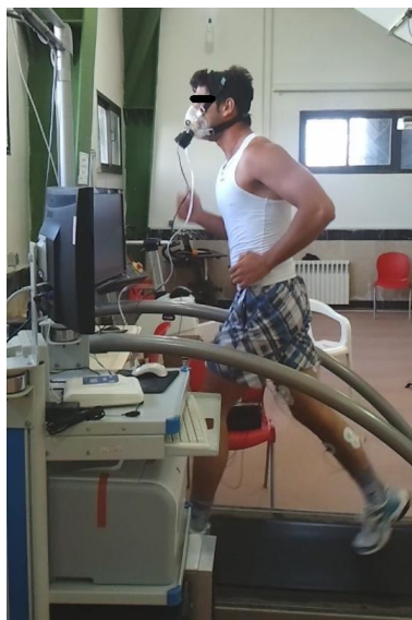
شکل ۱. پروتکل دویدن با استفاده از نوارگردان و دستگاه گاز آنالایزر متامکس در آزمایشگاه شبیه‌سازی شده به دویدن در یک مسابقه دو ۵۰۰۰ متر استقامت

هنگام اجرای آزمون، همچنان‌که سرعت دویدن افزایش می‌یافت، اکسیژن مصرفی نیز قبل از رسیدن به حالت پایدار افزایش پیدا کرد. برای بررسی تغییرات اکسیژن مصرفی در مجموع پروتکل به این صورت عمل شد که اکسیژن مصرفی دو دقیقه انتهایی تمام آزمودنی‌ها برای هر سه سرعت ۴، ۶ و ۸ کیلومتر بر ساعت انتخاب شد. در نتیجه برای هر وزن یک ستون از داده‌های اکسیژن مصرفی به دست آمد. با مقایسه اکسیژن مصرفی کل دوره آزمون در هر وزن، به مشاهده اثر تغییرات وزن کفش بر میزان تغییرات اکسیژن مصرفی و در نتیجه اقتصاد دویدن پرداخته شد. اقتصاد دویدن از طریق محاسبه میانگین اکسیژن مصرفی دو دقیقه انتهایی هر مرحله، در صورتی‌که به حالت پایدار می‌رسید، تخمین زده شد. میانگین اکسیژن مصرفی به دست آمده، هزینه اکسیژن را که برای رسیدن به آن سرعت نیاز است نشان می‌دهد که می‌تواند بین دوندها مقایسه شود. مصرف اکسیژن کمتر برای رسیدن به یک سرعت مشخص نشان‌دهنده دویدن اقتصادی‌تر است. برای محاسبه OUES از روش بابا و همکاران (۱۹۹۶) استفاده شد (۱۶) که در آن اکسیژن مصرفی (میلی لیتر بر دقیقه) روی محور عمودی و تهویه کل (میلی لیتر بر دقیقه بر کیلوگرم) در تابع لگاریتم روی محور افقی قرار می‌گیرد. شیب خط معادله یک مجهولی ارتباط دو محور افقی و عمودی به عنوان OUES در نظر گرفته می‌شود (معادله ۱) (۱۴، ۱۵).