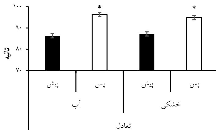
شکل شماره ۳. مقایسه تعادل ایستا (میانگین + انحراف معیار) پیش و پس از شش هفته فعالیت هوازی در آب و خشکی (ثانیه)