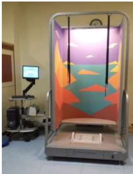
شکل ۱. دستگاه پاسچروگرافی پویای کامپیوتری.

برای اجرای آزمون SOT با انتخاب نوع آزمون تعبیه شده در دستگاه، شرکت‌کننده با پاهای برهنه بر روی سکوی نیروی دستگاه پاسچروگرافی می‌ایستاد به گونه‌ای که فاصله پاها به اندازه عرض لگن معادل ۵۰ درصد فاصله هیپ تا هیپ ۱ (خارهای خاصه قدامی - فوقانی ۲ )، دست‌ها در کنار بدن و نگاه به روبرو باشد. شرکت‌کنندگان در شش وضعیت مذکور مورد آزمون قرار گرفتند. طبق پروتکل تعریف شده، هر یک از این آزمون‌ها ۳ بار انجام شد و میانگین حاصل از سه بار به‌عنوان شاخص کنترل قامت (از صفر تا ۱۰۰) مورد استفاده قرار گرفت.