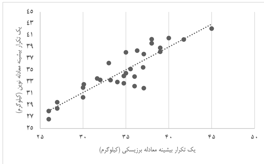
شکل ۱. همبستگی یک تکرار بیشینه با روش معادله برزیسکی و RPE