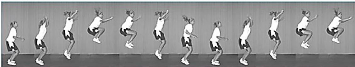
شکل ۱. تست پرش تاک (۳۳)

در این پژوهش قد آزمودنی‌ها با قدسنج و وزن آن‌ها از ترازوی دیجیتال استفاده شد. جهت ارزیابی نقص تنه از تست پرش تاک با پایایی بین آزمونگر (۹۳/۱) و پایایی درون آزمونگر (۸۷/۱) استفاده شد. در این آزمون فرد با پاهای باز به اندازه عرض شانه می‌ایستد و به صورت عمودی شروع به پرش می‌کند و زانوهای خود را تا حد امکان بالا می‌آورد. در بالاترین نقطه پرش، ران‌ها موازی با زمین قرار می‌گیرند. بلافاصله بعد از فرود، فرد باید پرش تاک بعدی را شروع کند. آزمودنی پرش تاک را به مدت ۱۰ ثانیه به صورت متوالی تکرار می‌کند. برای بهبود دقت ارزیابی از دو دوربین فیلمبرداری در دو نمای قدامی و جانبی استفاده شد، دوربین‌ها با فاصله سه متری از آزمودنی‌ها تنظیم شدند تا تصویر به صورت درشت‌نمایی شده برای بررسی در اختیار پژوهشگر قرار بگیرد، پس از انجام آزمون، برای بررسی سکانس‌های پرش، از نرم افزار کینوا استفاده شد فردی که قادر نباشد در محل شروع پرش خود فرود بیاید، در نقطه اوج پرش ران‌های موازی با زمین قرار نگیرد و پرش هایش در طول ۱۰ ثانیه با وقفه انجام گیرد، به عنوان فرد دارای نقص تنه در نظر گرفته شد (۱۸). هر آزمودنی سه بار با آزمون پرش ارزیابی شد و میانگین امتیازات ورزشکاران ثبت شد تا افراد مبتلا به نقص عصبی - عضلانی و به خصوص نقص تنه شناسایی شوند (شکل ۱) (۱۸).