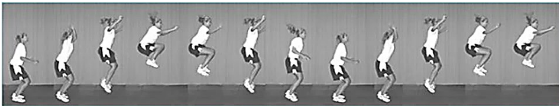
شکل ۱. تست پرش تاک (۳۳)

در این پژوهش قد آزمودنی‌ها با قدسنج و وزن آن‌ها از ترازوی دیجیتال استفاده شد. جهت ارزیابی نقص تنه از تست پرش تاک با پایایی بین آزمونگر (۹۳/۱) و پایایی درون آزمونگر (۸۷/۱) استفاده شد. در این آزمون فرد با پاهای باز به اندازه عرض شانه می‌ایستد و به صورت عمودی شروع به پرش می‌کند و زانوهای خود را تا حد امکان بالا می‌آورد. در بالاترین نقطه پرش، ران‌ها موازی با زمین قرار می‌گیرند. بلافاصله بعد از فرود، فرد باید پرش تاک بعدی را شروع کند. آزمودنی پرش تاک را به مدت ۱۰ ثانیه به صورت متوالی تکرار می‌کند. برای بهبود دقت ارزیابی از دو دوربین فیلمبرداری در دو نمای قدامی و جانبی استفاده شد، دوربین‌ها با فاصله سه متری از آزمودنی‌ها تنظیم شدند تا تصویر به صورت درشت‌نمایی شده برای بررسی در اختیار پژوهشگر قرار بگیرد، پس از انجام آزمون، برای بررسی سکانس‌های پرش، از نرم‌افزار کینوا استفاده شد فردی که قادر نباشد در محل شروع پرش خود فرود بیاید، در نقطه اوج پرش ران‌های موازی با زمین قرار نگیرد و پرش‌هایش در طول ۱۰ ثانیه با وقفه انجام گیرد، به عنوان فرد دارای نقص تنه در نظر گرفته شد (۱۸). هر آزمودنی سه بار با آزمون پرش ارزیابی شد و میانگین امتیازات ورزشکاران ثبت شد تا افراد مبتلا به نقص عصبی - عضلانی و به خصوص نقص تنه شناسایی شوند (شکل ۱) (۱۸).