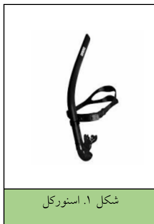
شکل ۱. اسنورکل