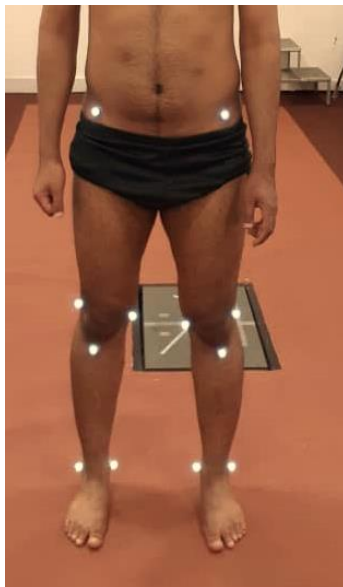
شکل ۲. لندمارک‌های آناتومیکی

BLA متعلق به شرکت پویان آزما (شکل ۳). برای هر آزمودنی، سه اندازه‌گیری توسط تکنسین‌های با تجربه انجام شد و میانگین این سه آزمون برای تجزیه و تحلیل مورد استفاده قرار گرفت.