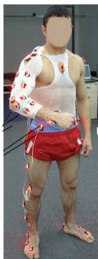
شکل ۱. جاگذاری مارکرها بر روی بدن

مسابقه‌ای با فاصله زمانی ۱۰ ثانیه بین هر ضربه در ارتفاع کمربند و دهان اجرا کردند که از بین آنها سریع‌ترین و بهترین مهارت گیباکوزوکی جوان و چودان که از نظر درست بودن ماهیت اجرا هم مورد تایید مربیان بود، ثبت گردید.