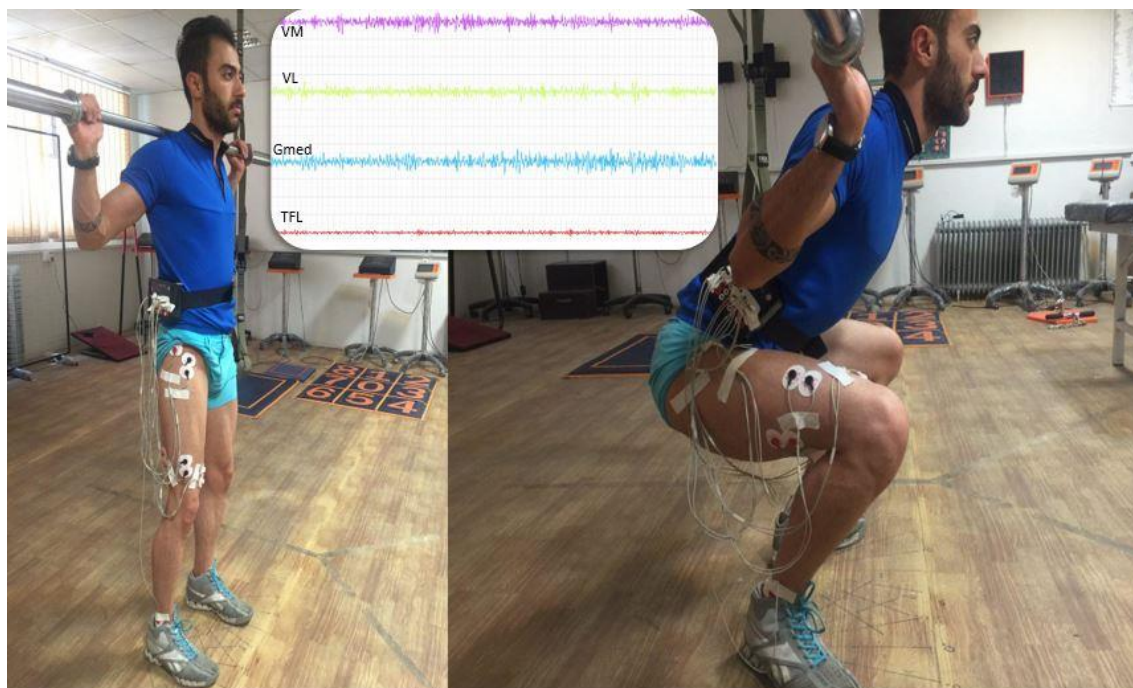
شکل ۲. انجام حرکت اسکات با زوایای مختلف مفصل هیپ

داده‌های حاصل از ثبت فعالیت الکترومایوگرافی عضلات به مدت هشت ثانیه بدون تفکیک فاز کانستریک و اکستریک حرکت اسکات با فرکانس نمونه‌برداری ۱۰۰۰ هرتز و با پهنای باند ۱۰ تا ۴۵۰ Hz فیلتر (band-pass filtered) شد و با استفاده از شیوه ریشه میانگین مجذور (RMS) با پنجره‌ی زمانی صد میلی‌ثانیه محاسبه گردید. به منظور نرمالیز کردن داده‌ها، برای هر آزمودنی داده‌های پردازش شده RMS برای هر عضله به مقدار RMS به دست آمده از حداکثر فعالیت عضله (MVIC) تقسیم گردید و سپس برای ایجاد درصدی از مقدار حداکثر فعالیت عضله، عدد حاصل در عدد ۱۰۰ ضرب گردید؛ بنابراین میزان فعالیت هر عضله بر اساس درصدی از حداکثر مقدار فعالیت عضله در هر مرحله بیان شد. همچنین برای محاسبه نسبت فعالیت Gmed/TFL ، RMS عضله Gmed به RMS عضله TFL تقسیم شد و برای محاسبه نسبت فعالیت VM/VL ، RMS عضله VM به RMS عضله VL تقسیم شد. برای تحلیل سیگنال‌های خام از نرم‌افزار LabVIEW ۱ و برای تحلیل آماری داده‌ها از آزمون فریدمن و ویلکاکسون استفاده شد.