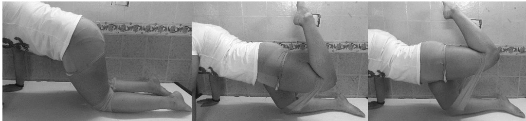
شکل ۳ نحوه انجام تمرین آزمودنی‌های گروه تجربی (از چپ به راست: ابتدا، میانه و انتهای حرکت باز کردن ران با مقاومت کش تمرین)

بیش از حد ران در برابر مقاومت کش تمرین) و برای ویژه تر کردن تمرین به صورت برونگرا، ۳ ثانیه انقباض برونگرا (حرکت خم کردن ران (بازگشت به وضعیت شروع حرکت)) طبق تصویر شماره ۳ انتخاب شد. اگرچه آزمون بر روی پای برتر افراد صورت می گرفت، به دلایل اخلاقی و به جهت برهم نزدن تعادل عضلانی بدن در دو سمت، تمرینات تقویتی به صورت متقارن برای هر دو پا انجام گرفت.