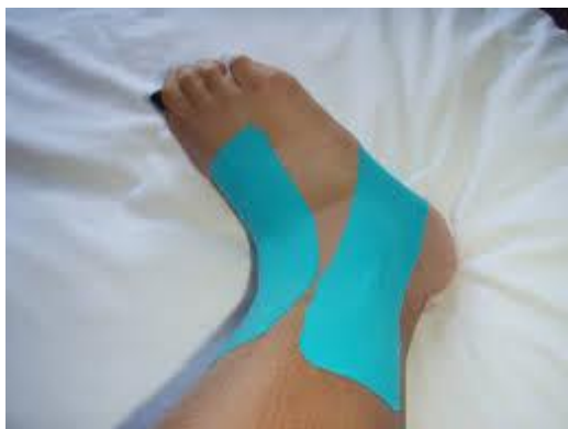
شکل ۱. تیپ کینزیو در مچ پا