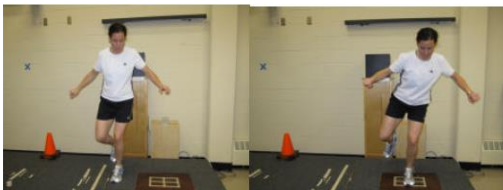
شکل ۲. نحوه انجام پروتکل جهش جانبی روی دستگاه توزیع فشار کف پای