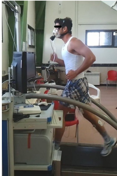
شکل ۱. پروتکل دویدن با استفاده از نوارگردان و دستگاه گاز آنالایزر متامکس در آزمایشگاه شبیه‌سازی شده به دویدن در یک مسابقه دو ۵۰۰۰ متر استقامت

هنگام اجرای آزمون، همچنان‌که سرعت دویدن افزایش می‌یافت، اکسیژن مصرفی نیز قبل از رسیدن به حالت پایدار افزایش پیدا کرد. برای بررسی تغییرات اکسیژن مصرفی در مجموع پروتکل به این صورت عمل شد که اکسیژن مصرفی دو دقیقه انتهایی تمام آزمودنی‌ها برای هر سه سرعت ۴، ۶ و ۸ کیلومتر بر ساعت انتخاب شد. در نتیجه برای هر وزن یک ستون از داده‌های اکسیژن مصرفی به دست آمد. با مقایسه اکسیژن مصرفی کل دوره آزمون در هر وزن، به مشاهده اثر تغییرات وزن کفش بر میزان تغییرات اکسیژن مصرفی و در نتیجه اقتصاد دویدن پرداخته شد. اقتصاد دویدن از طریق محاسبه میانگین اکسیژن مصرفی دو دقیقه انتهایی هر مرحله، در صورتی‌که به حالت پایدار می‌رسید، تخمین زده شد. میانگین اکسیژن مصرفی به دست آمده، هزینه اکسیژنی را که برای رسیدن به آن سرعت نیاز است نشان می‌دهد که می‌تواند بین دوندها مقایسه شود. مصرف اکسیژن کمتر برای رسیدن به یک سرعت مشخص نشان‌دهنده دویدن اقتصادی‌تر است. برای محاسبه OUES از روش بابا و همکاران (۱۹۹۶) استفاده شد (۱۶) که در آن اکسیژن مصرفی (میلی لیتر بر دقیقه) روی محور عمودی و تهویه کل (میلی لیتر بر دقیقه بر کیلوگرم) در تابع لگاریتم روی محور افقی قرار می‌گیرد. شیب خط معادله یک مجهولی ارتباط دو محور افقی و عمودی به عنوان OUES در نظر گرفته می‌شود (معادله ۱) (۱۴، ۱۵).