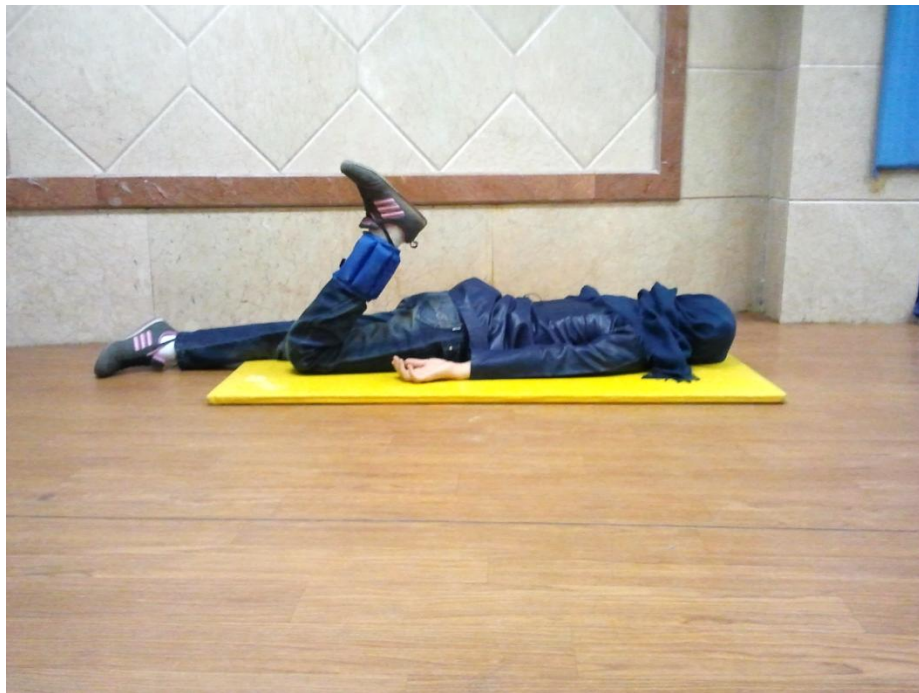
شکل ۲ تمرین قدرتی فلکشن زانو