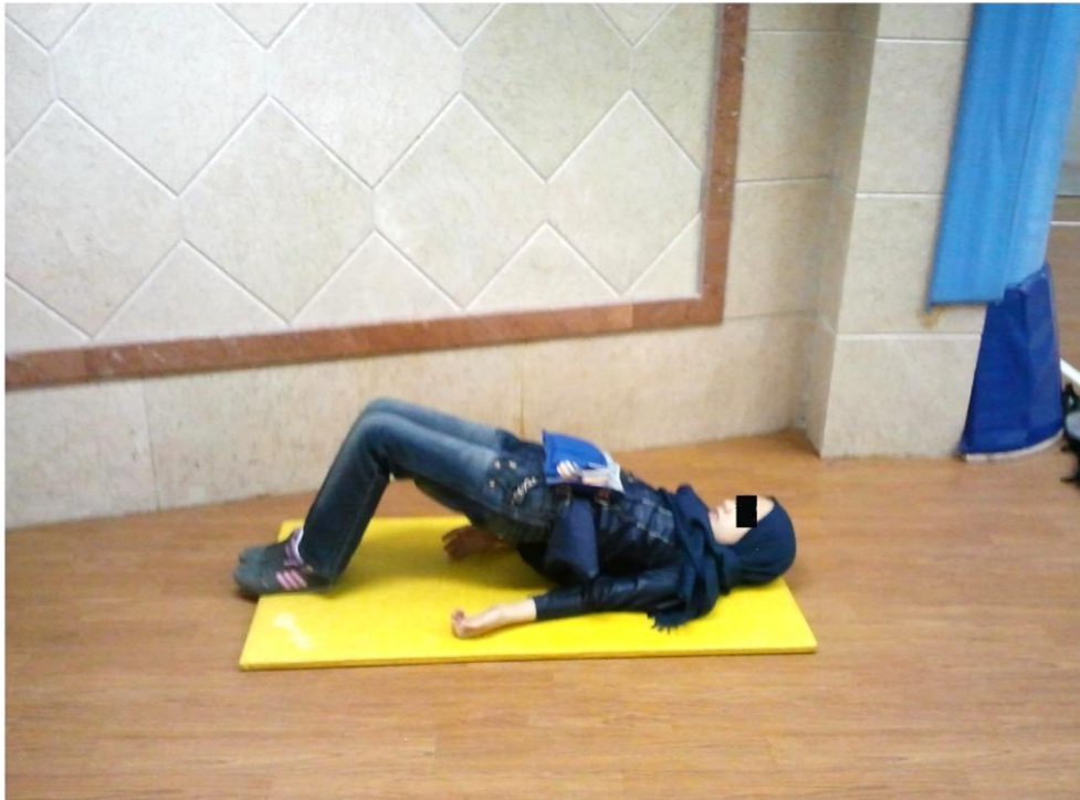
شکل ۱ تمرین قدرتی پل زدن

آماری با استفاده از نرم‌افزار اس پی اس اس نسخه ۱۶ در سطح اطمینان ۹۵ درصد \alpha در سطح معناداری ۰.۰۵ انجام شد.