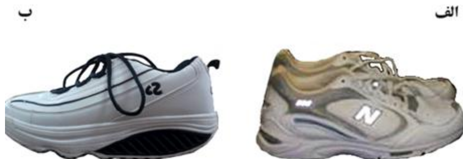
شکل ۱- الف: کفش کنترل؛ ب: کفش ناپایدار

کفش‌های تحت بررسی در این پژوهش در اندازه‌های ۴۲ تا ۴۴ برحسب اندازه پای آزمودنی‌ها تهیه شدند که شامل کفش کنترل (New Balance) و کفش ناپایدار (Perfect Steps- TM-030709 VP) بود (شکل ۱). این کفش‌ها به منظور مقایسه تأثیر شکل هندسه زیره کفش بر متغیرهای مرتبط با نیروی عکس‌العمل زمین انتخاب شدند. کفش ناپایدار انحنایی در راستای قدامی - خلفی دارد؛ درحالی که کفش کنترل دارای زیره معمولی بود.