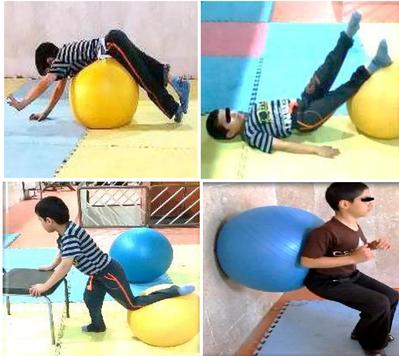
شکل ۳. نمونه‌هایی از تمرینات انجام شده

در تحقیق حاضر برای طبقه‌بندی و خلاصه‌سازی اطلاعات از آمار توصیفی، میانگین و انحراف معیار و برای تحلیل داده‌ها از آزمون t وابسته در سطح معناداری ( P \leq 0/05 ) در نرم افزار آماری SPSS نسخه ۲۲ استفاده شد.