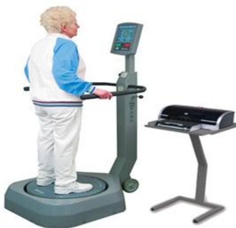
تصویر ۱. دستگاه بایودکس؛ فرد در حال تست تعادل

دستگاه بایودکس دارای یک صفحه نیرو است که درجه دشواری حالت پویای آن از ۱ تا ۱۲ است و یک حالت ایستای کامل نیز دارد. درجه ۱ بیشترین ناپایداری را دارد و برای اجرای مشکل‌تر است و درجه ۱۲ کمترین درجه ناپایداری را دارد و ساده‌ترین حالت برای اجرای تعادلی پویا است. برای هر فرد با توجه به نحوه قرارگیری اطلاعات مربوط به زوایای پاها و مختصات تماس پاشنه با صفحه ثبت می‌شود.